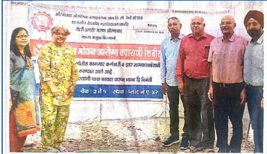
रक्तदान शिबिरास उत्स्फूर्त प्रतिसाद मिळाला.