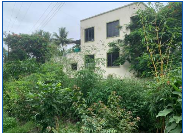
ACIEL : Aurangabad Co-operative Industrial Estate Ltd.