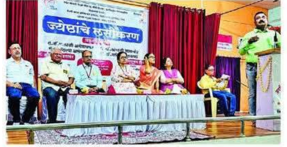
ज्येष्ठांचे लसीकरण हे एक महत्त्वपूर्ण पाऊल या कार्यक्रमास उपस्थित मान्यवर.